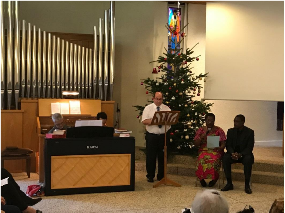
Le pasteur fait Intervieweur comme un journaliste à la TV